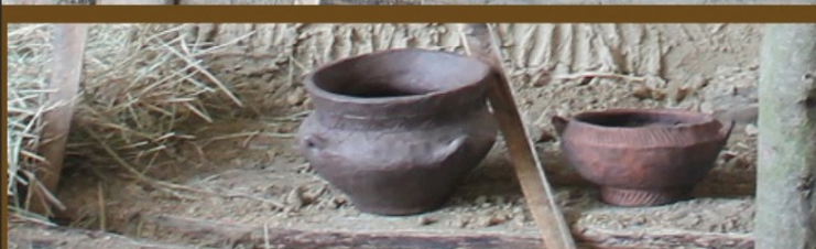
Człowiek i naczynia z okresu kiedy wznoszono grobowce megalityczne.

Projekt Budowa trasy megalitycznej „WROTA CZASU” został zrealizowany przez dwie Lokalne Grupy Działania Stowarzyszenie „WIR” – Wiejska Inicjatywa Rozwoju i Stowarzyszenie „Lider Pojezierza” we współpracy z Samorządem Województwa Zachodniopomorskiego. Projekt współfinansowany ze środków Unii Europejskiej w ramach działania „Wsparcie dla rozwoju lokalnego w ramach inicjatywy LEADER” objętego Programem Rozwoju Obszarów Wiejskich na lata 2014–2020, poddziałanie 19.3 „Przygotowanie i realizacja działań w zakresie współpracy z lokalną grupą działania” objętego Programem Rozwoju Obszarów Wiejskich na lata 2014–2020.