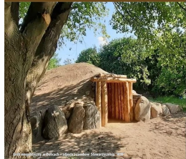
Grob megalityczny w Dolicach